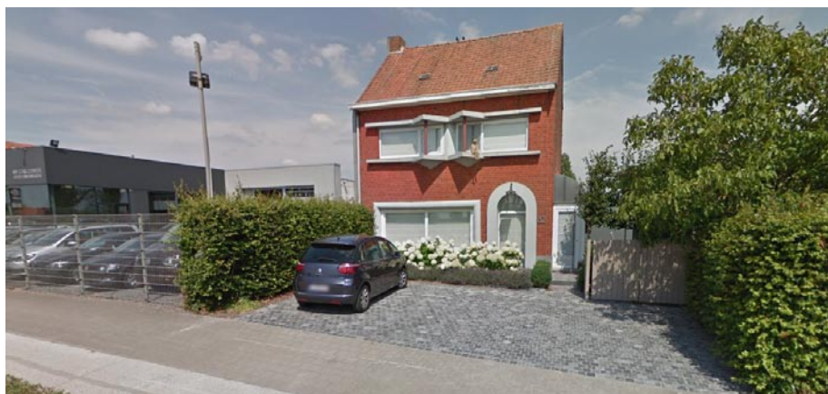
Den Ast/Normandie/Peter Pan in 2018